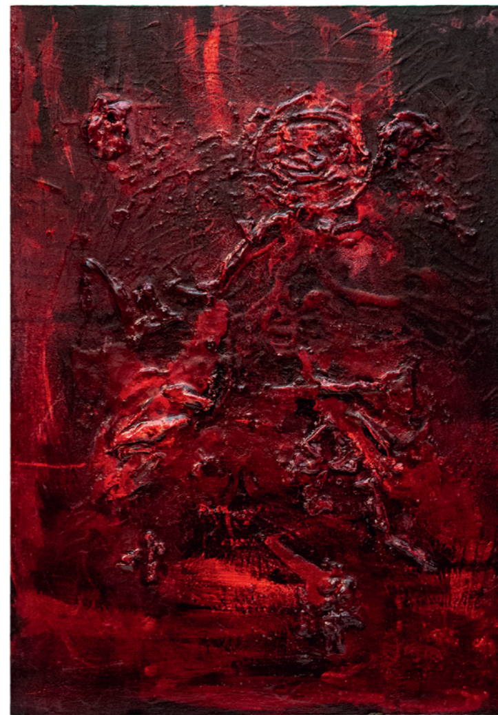
Our Darkness Title from the Song Our Darkness by Anne Clark 2026, Schellacktusche und Acrylfarbe auf Dibond-Platte, 66 x 46 cm