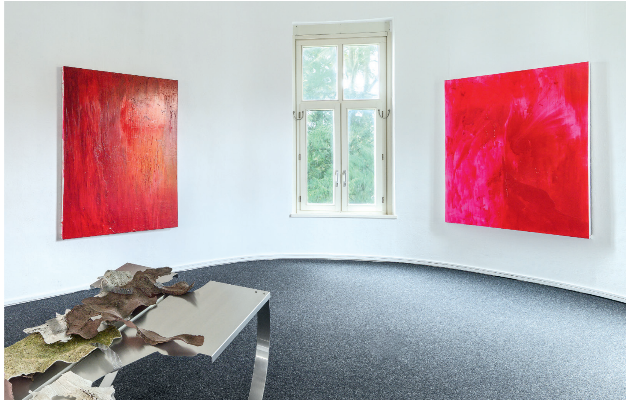
links: Right to Riot , Title from the Song Right to Riot by Hagop Tchapanian 2026, Schellacktusche und Acrylfarbe auf Vinylfolien-Leinwand, 180 x 140 cm rechts: DUST , Title from the Song Dust by MIOIOIN 2026, Schellacktusche und Acrylfarbe auf Vinylfolien-Leinwand, 180 x 140 cm

Titelbild: Don't, Title From the Song I Don't Want To See Tomorrow by Nat King Cole, 2024, Öl und Acrylfarbe auf Vinylfolien-Leinwand, 180 x 140 cm