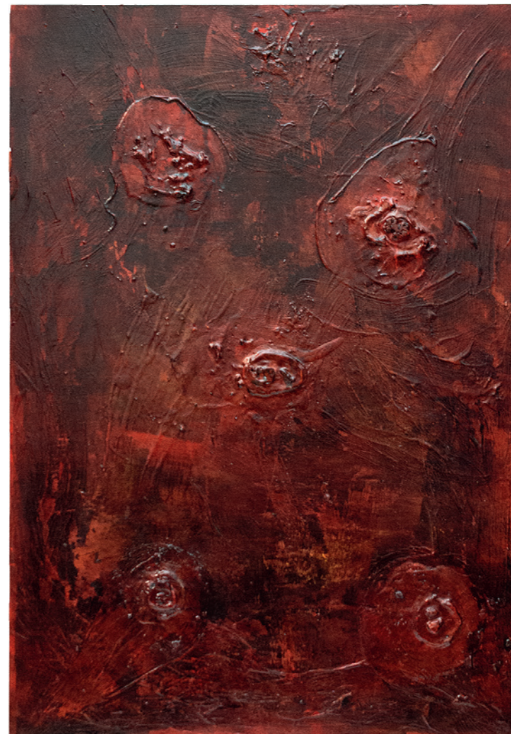
Challengers Title from the Song Challengers by Trent Reznor and Atticus Ross 2026, Schellacktusche und Acrylfarbe auf Dibond-Platte, 66 x 46 cm

1 Vuong, Ocean: Daily Bread . In: Ders.: Nachthimmel mit Austrittswunden . München: Hanser Verlag 2020, S. 73.