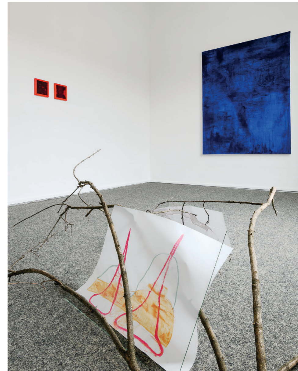
links: Je suis le vent , Title from the Song Je suis le vent by Working For A Nuclear Free City 2026, Schellacktusche und Acrylfarbe auf Plexiglas, 16,5 x 15 cm You' il Be UNDER MY WHEELS , Title from the Song You' il Be UNDER MY WHEELS by The Prodigy 2026, Schellacktusche und Acrylfarbe auf Plexiglas, 16,5 x 15 cm