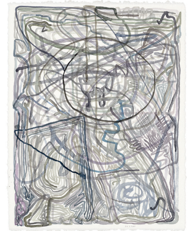
Corona Fabula - 21.03.2020 Aquarellfarbe auf Aquarag 65 x 51 cm