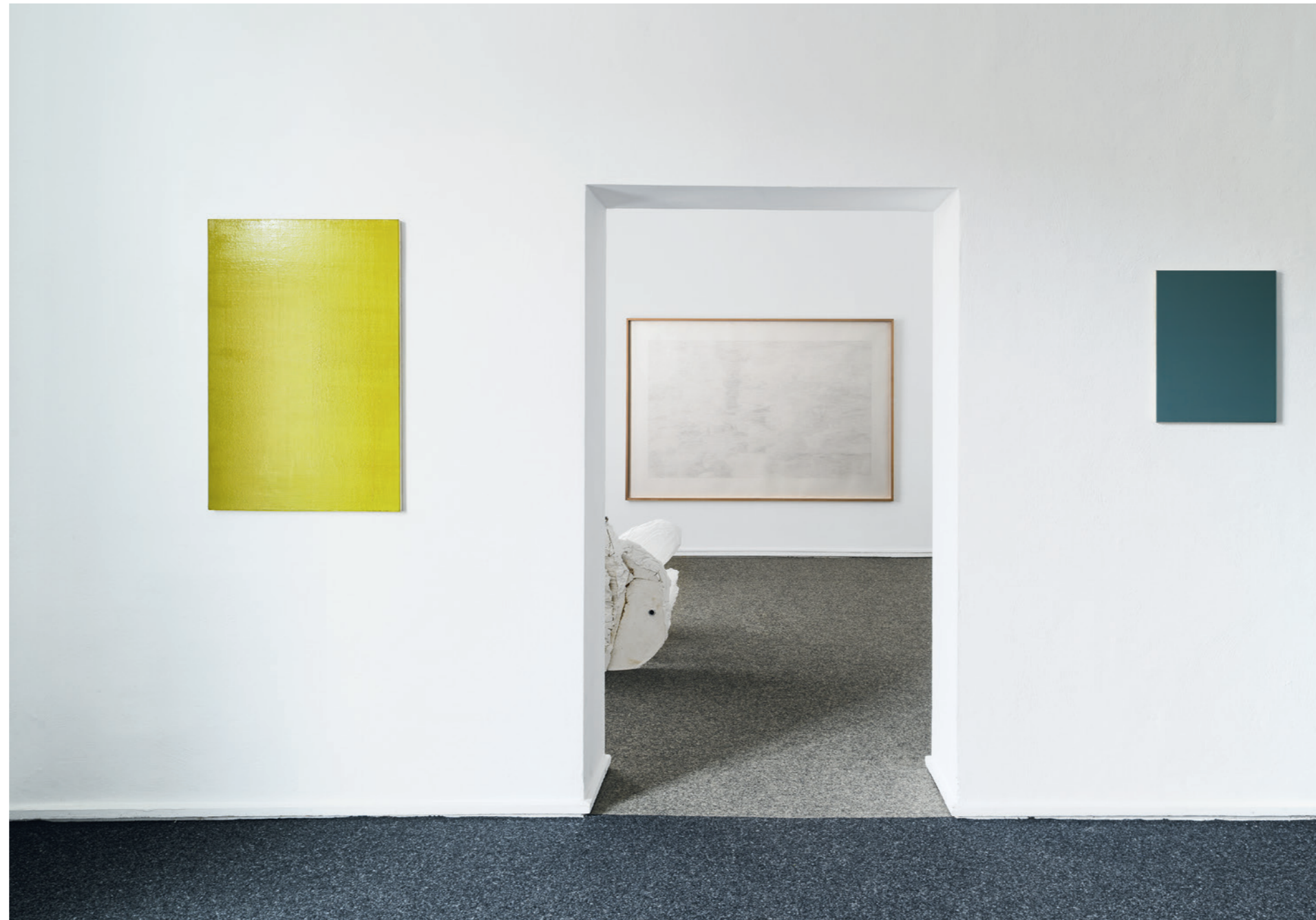
links: LB 1993 Gelb, Ölfarbe auf Leinwand, 96 x 63 cm mitte: Z 2010 -A, Beistift auf Zerkall-Büttenpapier, 155 x 255 cm rechts: LB 1995 Türkis, Ölfarbe auf Leinwand, 51 x 41 cm

Titelbild: Kaskade, 2022/2025, Diaphane Glasfarbe auf 18 Folienbildtafeln 125 x 70 cm, Gesamtgröße ca. 340 x 290 x 80 cm