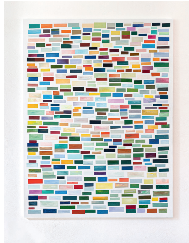
CAF LB 2026-1 Ölfarbe auf Leinwand 160 x 120 cm