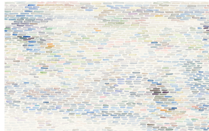
BAL Az 2019 -2 (Detail) Aquarellfarbe auf Britannia 70 x 100 cm

www.ineshock.de www.instagram.com/ines.hock.atelier www.de.wikipedia.org/wiki/Ines_Hock